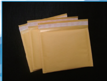
屏蔽信封 其他附属产品